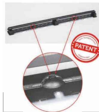
/ Hinter der Schutzkontur befindet sich die Klappendämpfung.

sam geschlossen. Alles wie gehabt innerhalb einer Sekunde.“ Die Softmotion-Technologie stellt für die immer häufiger werden- den Extremwetterereignisse einen wichtigen Baustein dar. (sk)