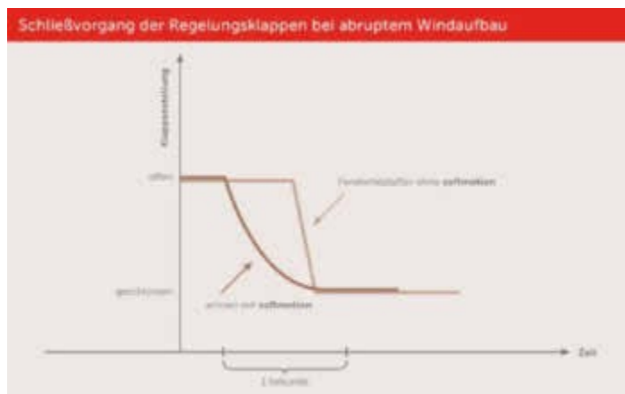
/ Die Klappendämpfung beeinflusst den Kurvenverlauf des Schließvorgangs positiv.

Innoperform hat seinen selbst-regulierenden Fensterfalzlüfter „Arimeo“ weiter optimiert und mit einer Softmotion-Technologie ergänzt. Das modifizierte Fließgelenk sorgt für sanft geregelte Luftströme mit gedämpfter Klappenregelung. Die Softmotion-Technologie wird durch eine Werkstoffkombination