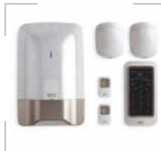
/ Das vorkonfigurierte Funk-Set „Pack Tyxa+“ beinhaltet alles, was für ein Plus an Sicherheit benötigt wird.

te Funk-Set „Pack Tyxa+“ an, bestehend aus einer Alarmzentrale mit Sirene, zwei Bewegungsmeldern, einer Bedieneinheit und zwei Fernbedienungen im Schlüsselanhänger-Format. (sk)